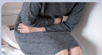
분변-구강 경로 감염