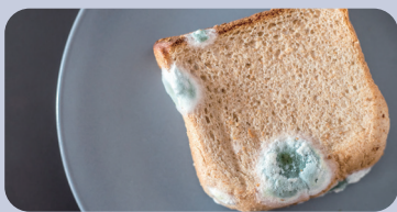
오염된 물이나 식품