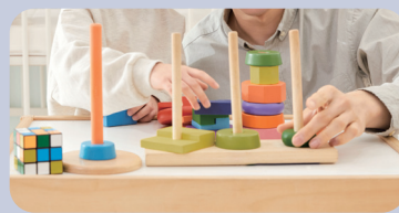
접촉 감염 및 호흡기 감염