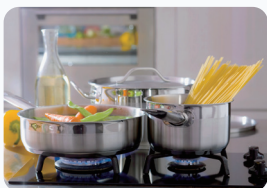
음식 익혀먹기 중심온도 까지 충분히 가열하여 섭취